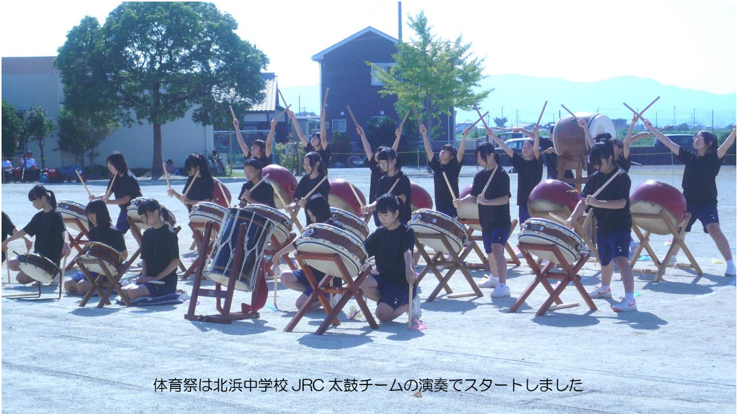
体育祭は北浜中学校 JRC 太鼓チームの演奏でスタートしました

有滝・村松町民体育祭は今年で十年という節目を迎えました。また、「北浜はつらつスポーツクラブ」が主催していたこの体育祭は、「北浜まちづくり会議」が設置された今年から同会議が主催し、「有滝町会」、「村松町会」のご支援の下、同クラブに実行をお願いする形で開催しました。