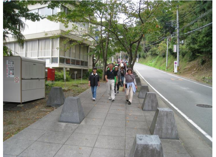
（猿田彦神社手前の下り坂／まもなくゴール）