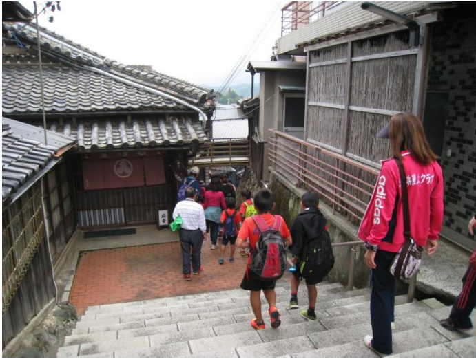
（麻吉旅館を散策する参加者）